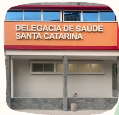
Centre de soin à Assomada